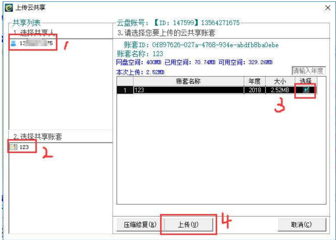
(上传修改后的共享账套)

7、您这边上传成功后，共享该账套的好友就可以在她的电脑上登录 e 会计查看修改后的共享账套，具体步骤是：进入【云共享】-点击【我的云共享】，在共享列表选中【共享的人】和【共享的账套】，在右侧可以选中需要下载的共享账套，点击【下载】，下载共享账套成功后，您可以【选择账套】的界面看到已经下载成功的共享账套，选中该账套，点【确定】，登录该共享账套查看数据。